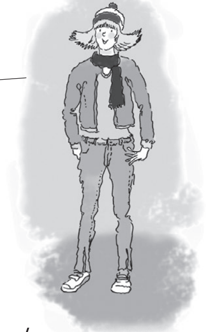
Tabela samooceny 3

10. Powiedz, co najchętniej zakładasz do szkoły (3 informacje) i na dyskotekę (3 informacje).